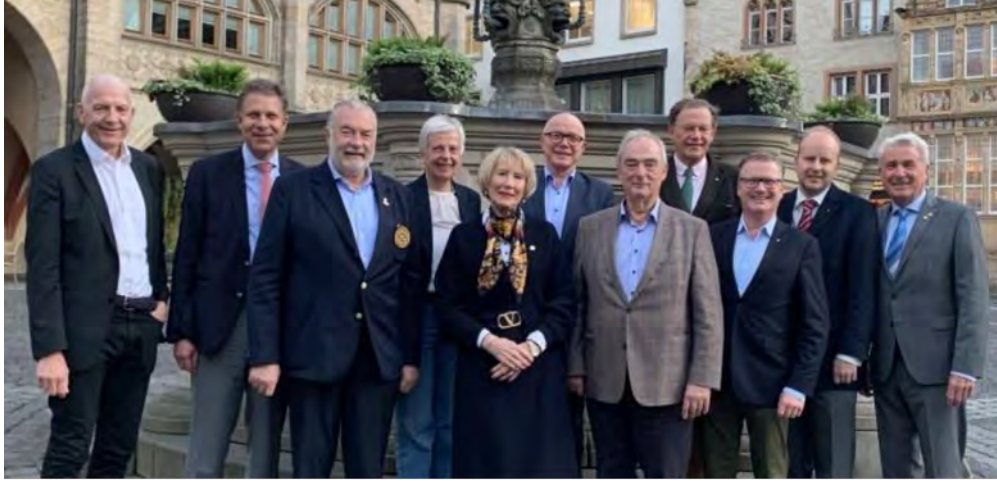
Vorstand und Beirat "Rotarischer Freundeskreis für das Neue Kreisau e.V." in Hildesheim.