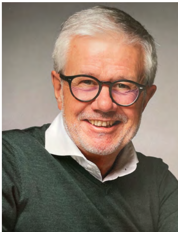
Governor Ludwig Kalthoff